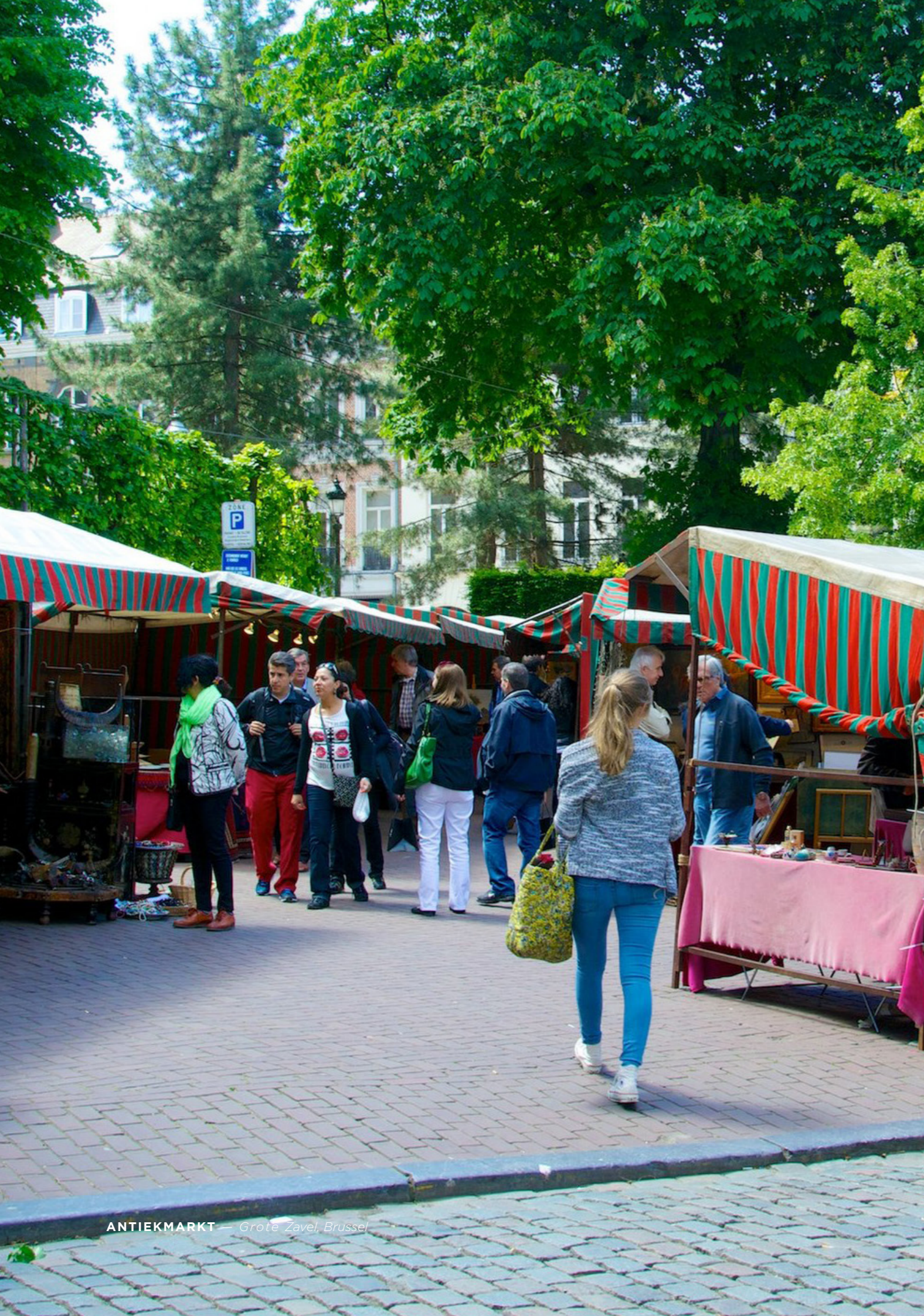
ANTIEMARKT — Grote Zavel, Brussel