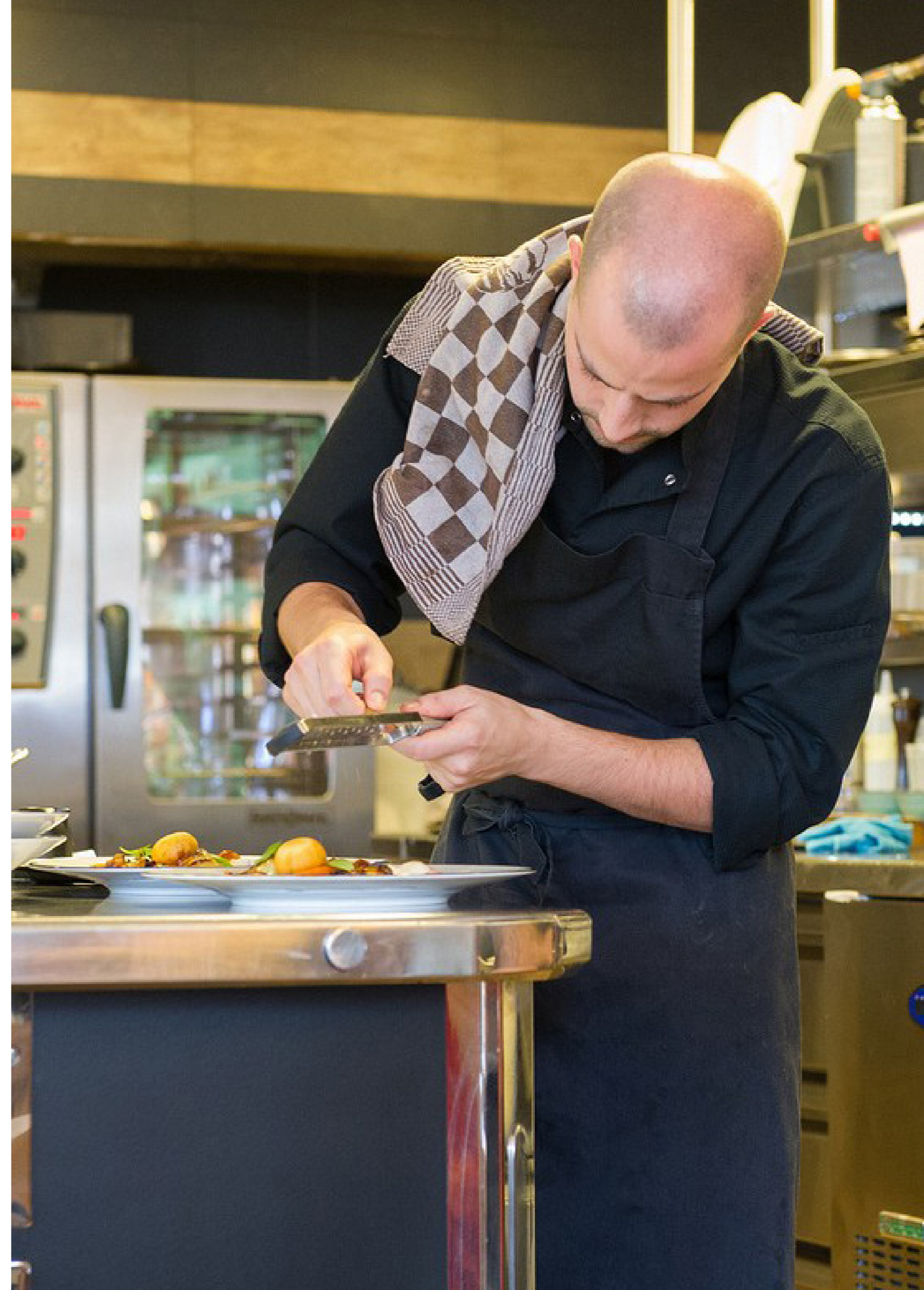
LA PAIX — Michelin 2-sterren restaurant in Anderlecht, Brussel