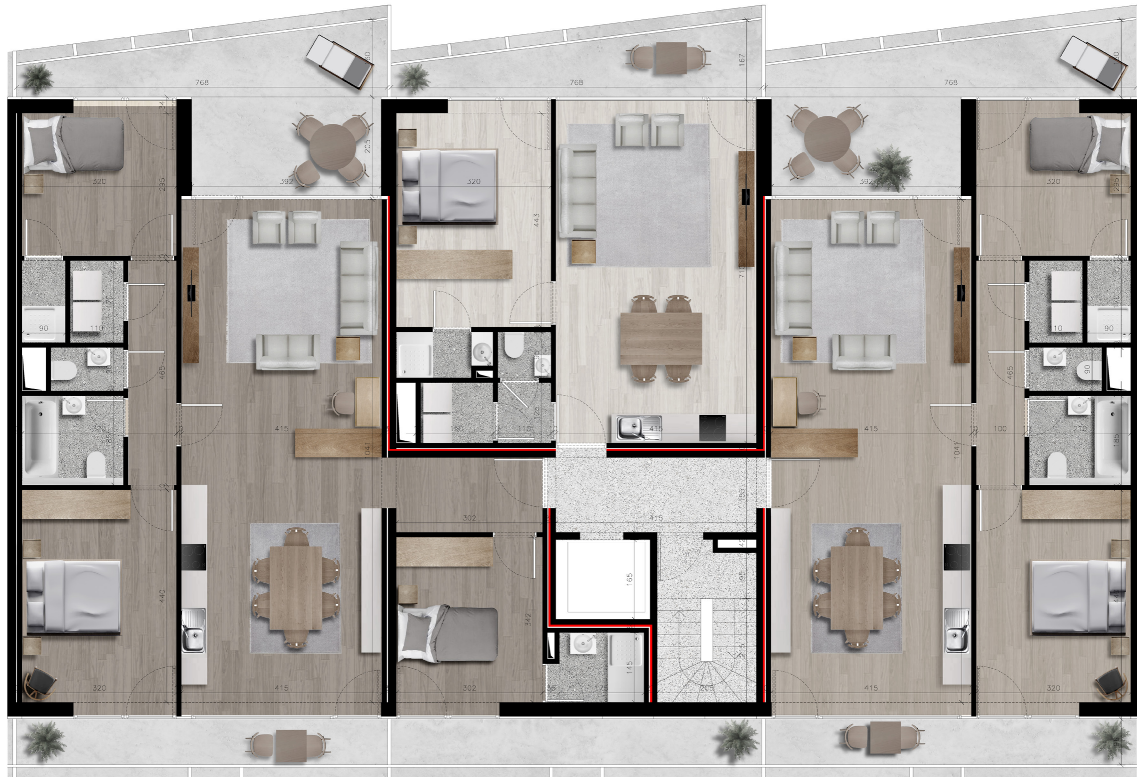
Twee-slaapkamer appartement 92m 2 , terras 24m 2