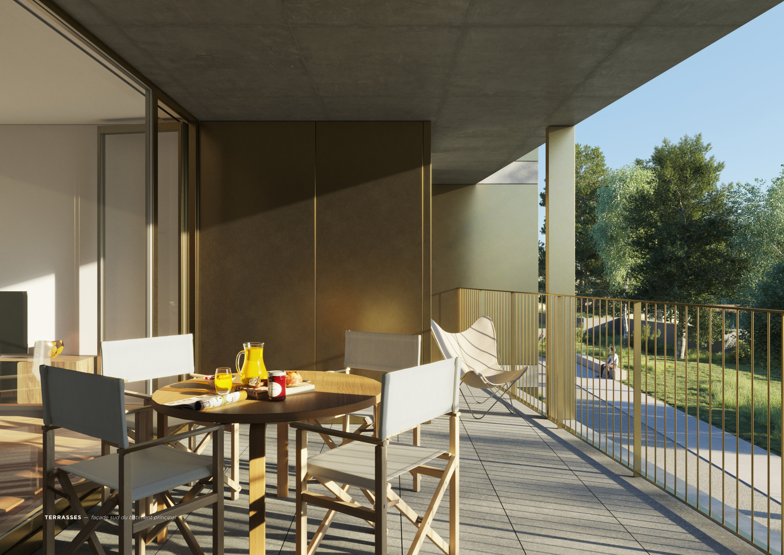
TERRASSES — façade sud du bâtiment principal