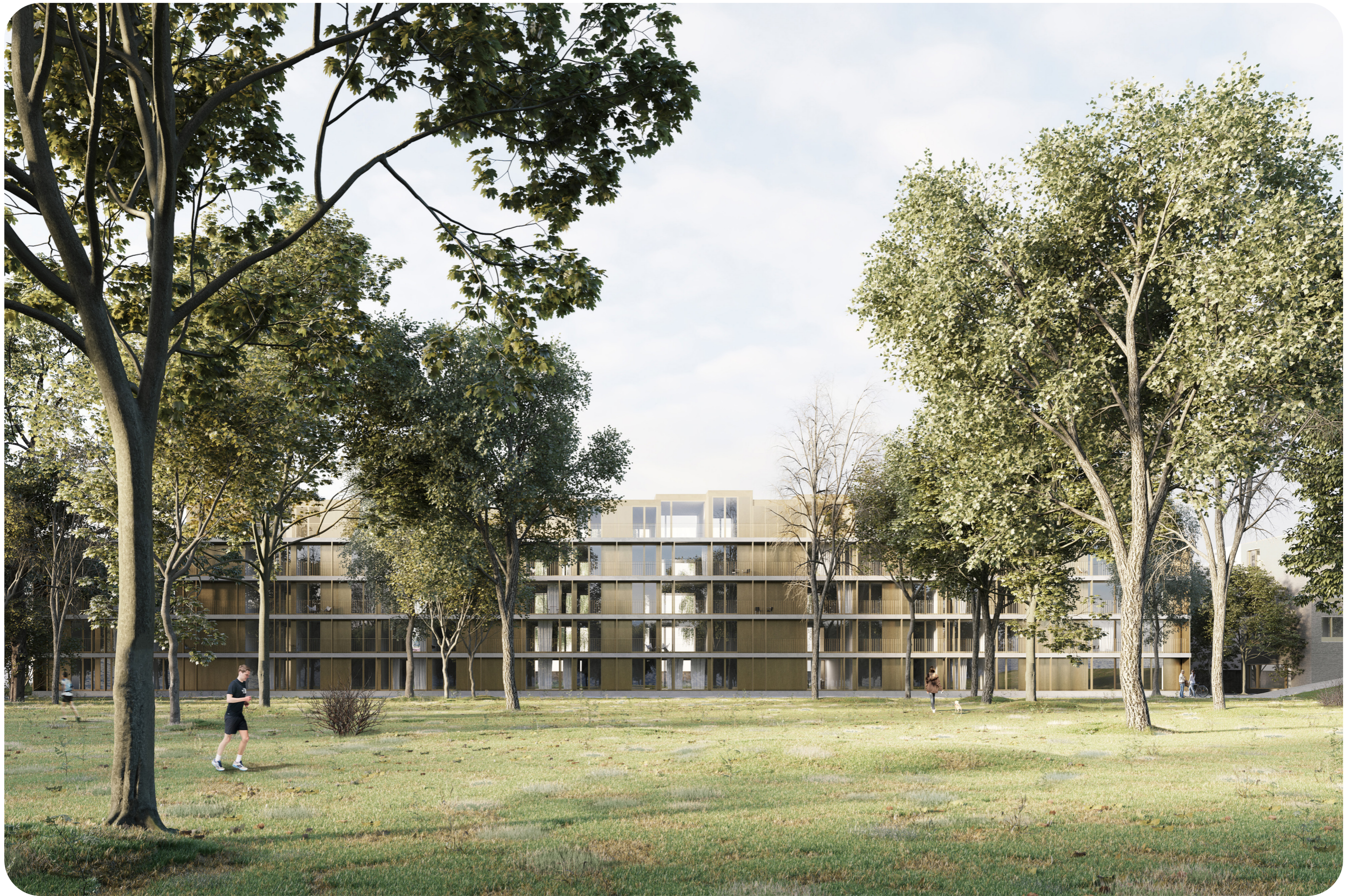
VUE DU PARC — façade principale du bâtiment principal