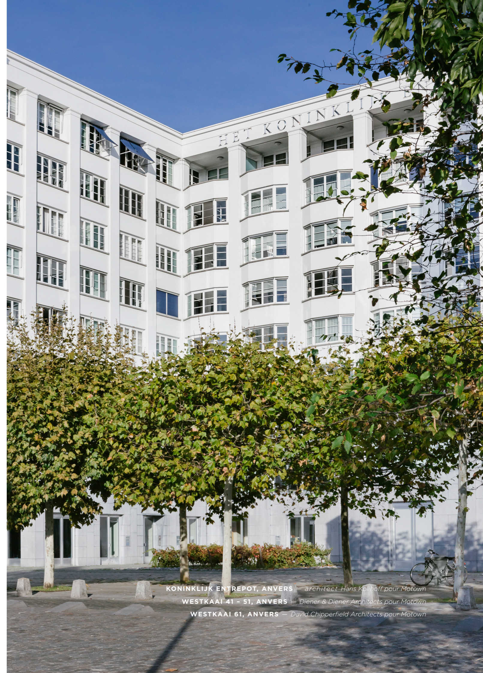
KONINKLIJK ENTREPOT, ANVERS — architect Hans Kollhoff pour Motown